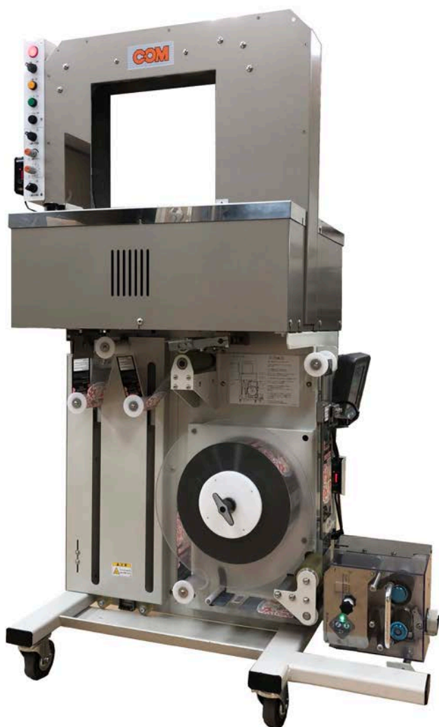
WAS-250-75 型 (サーマルプリンタタイプ)

印刷テープ位置決め機能、サーマルプリンタを搭載した自動帯束機。 ラベルの代わりにテープに直接賞味期限や製造年月日の印字が可能に。